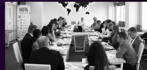
Деловые завтраки и ужины